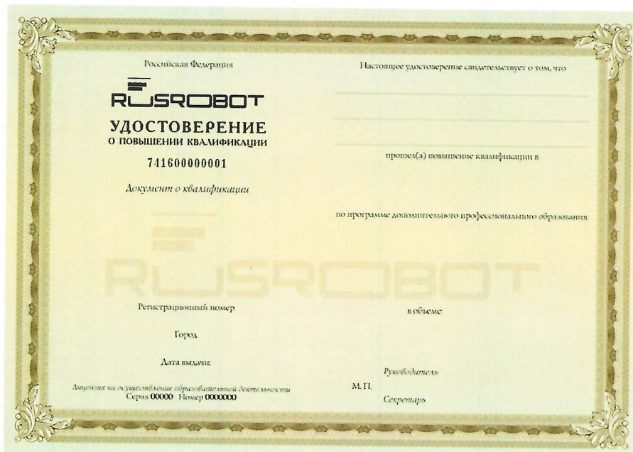
Рисунок 2: Обратная сторона бланка удостоверения о повышении квалификации